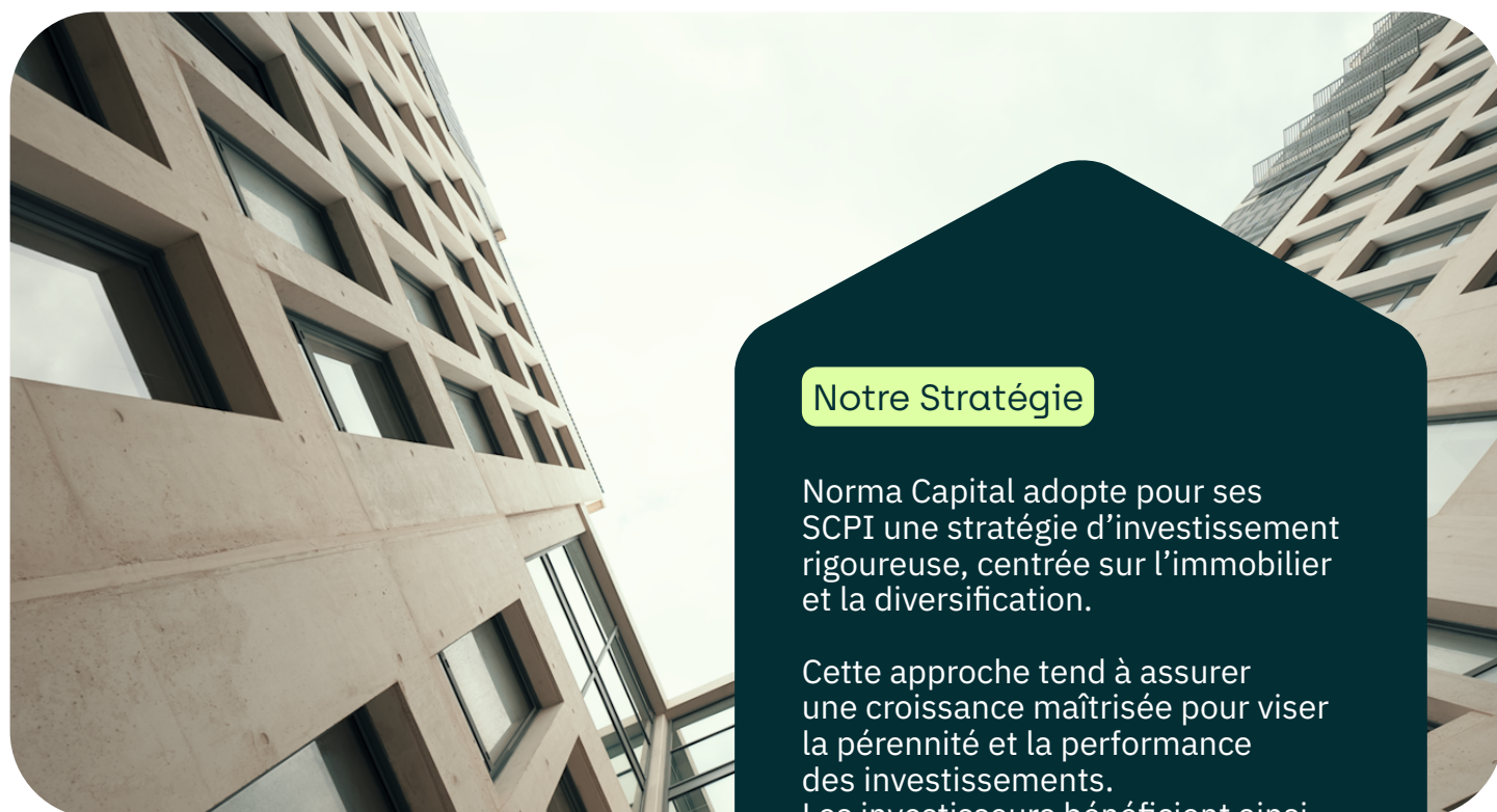
Norma Capital - Adriana - Marseille.

Investir dans des actifs sélectionnés dans des marchés européens dynamiques pour une épargne diversifiée au-delà de nos frontières.